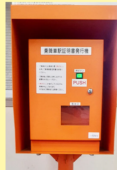
乗降車駅証明書発行機 승하차역 증명서 발행기